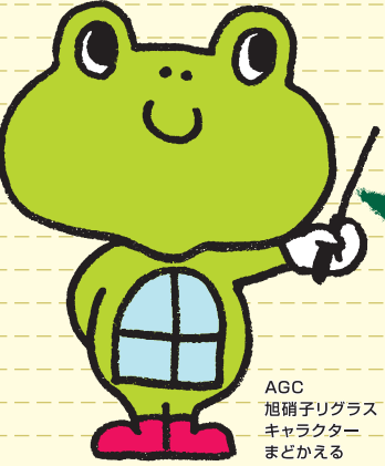
AGC 旭硝子リガラス キャラクター まどかえる

窓のリフォームをしたいけれど、どれを選べば良いのか分からない。 そんな窓の選択でお悩み中の方は、このYES/NOチャートで簡易診断をしてみましょう。 きっとご自宅の環境に適した、希望通りのエコ窓リフォームが見つかるはずです！