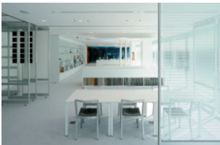
ガラス・スタジオ